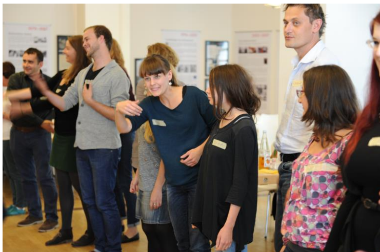
Workshop “Prezentace a moderace”, Stuttgart 2014