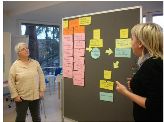
Setkání projektového konsorcia Tübingen, březen 2013

V rámci trvání projektu vyrostla síť z účastníků, vedoucích dílen, seminářů, členů konsorcia, zástupců dalších zúčastněných institucí a umělců tak, že v budoucnu bude mnohem snazší kulturní výměna a myšlenkové srůstání Evropy a to v rozličných konstelacích a projektech.