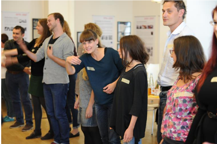
Workshop für Präsentation und Moderation, Stuttgart 2014