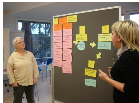
Consortialtreffen Tübingen, März 2013

Im Projektverlauf ist ein Netzwerk aus Teilnehmern, Werkstatteleitern, Mitgliedern des Consortiums, Vertretern aus andere beteiligten Institutionen und Künstler gewachsen, das in der Zukunft den kulturellen Austausch und das Zusammenwachsen Europas gemeinsam in unterschiedlichen Konstellationen und Projekten voranbringen wird.