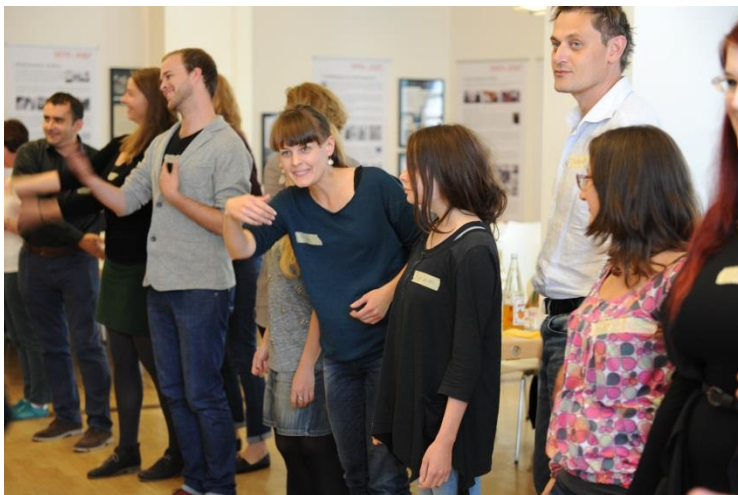
Warsztat na temat prezentacji i moderowania dyskusji, Stuttgart 2014