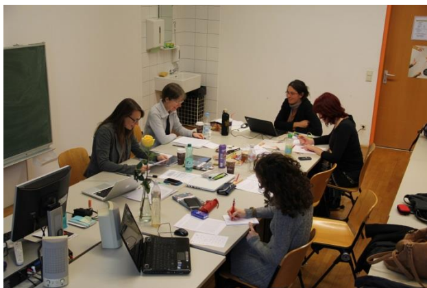
Warsztat grupy słoweńsko-niemieckiej, Graz, jesień 2013

W trakcie realizacji projektu odbyły się trzy spotkania warsztatowe dla każdej z grup. Ponadto grupy uczestniczyły też w spotkaniach realizowanych on-line , których celem była analiza bieżących postępów w pracy nad tłumaczeniami. Celem spotkań warsztatowych było doskonalenie kompetencji przyszłych promotorów kultury w zakresie przekładu literackiego; ich uczestnicy mieli możliwość wspólnej pracy nad przekładem wybranych tekstów literackich. Oprócz tej pracy, która przebiegała głównie w tandemowych grupach językowych, w projekcie zostały przewidziane również spotkania o charakterze ogólnym, w których uczestniczyły wszystkie grupy. Ponadto uczestnicy projektu byli zobowiązani do indywidualnej pracy nad przekładem wybranych tekstów, jednak i w tym przypadku mogli liczyć na wsparcie mentora danej grupy, czy innych jej członków.