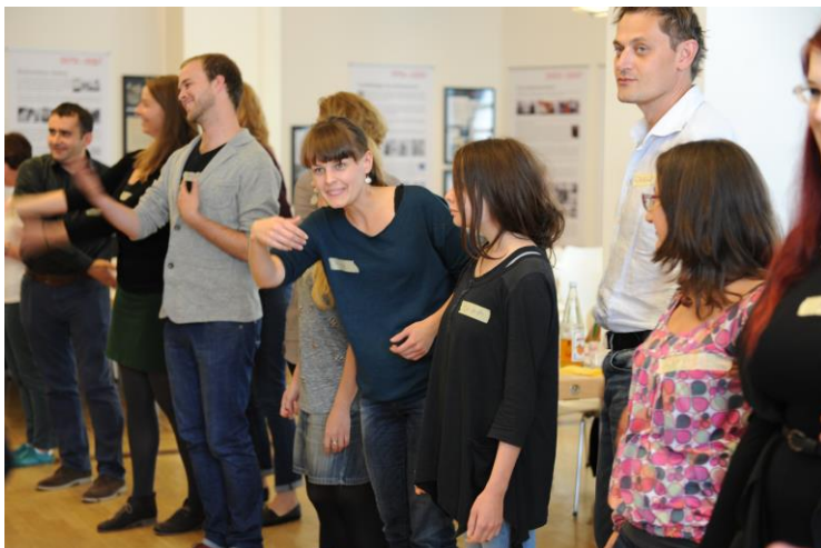
Воркшоп з мистецтва презентації та модерації, Штуттґарт 2014 р.

У ході проекту відбулися дві мережеві зустрічі учасників і партнерів, у центрі яких стояв, передусім, менеджмент у сфері культури. Семінари і воркшопи з культурного менеджменту проводили професійні культ менеджери з країн-учасниць проекту.