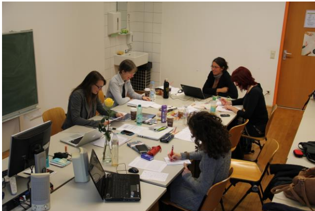
Перекладацька майстерня словенсько-німецької групи, Грац, осінь 2013 року.

Шляхом двоступеневої процедури до участі у проекті були відібрані 50 студентів і молодих фахівців із восьми країн Європи. Учасники були розділені на групи по п'ять осіб залежно від робочих мов. Кожна група працювала під орудою керівника, досвідченого успішного перекладача. Кожна мовна пара мала групи-тандеми, учасники яких обмінювалися проблемами і викликами художнього перекладу. У рамках проекту для всіх груп проведено три очні майстерні. Крім того, групи мали онлайн-зустрічі, на яких обговорювалися переклади. У ході майстерень та онлайн-зустрічей майбутні культурні посередники отримали вишкіл з художнього перекладу, працюючи усі разом над перекладами художніх творів. Крім роботи у двомовних групах учасники мали можливість працювати на спільних для всіх мов семінарах і в тандемах. Також учасники працювали над перекладами самостійно за підтримки менторів і своїх колег по групі.