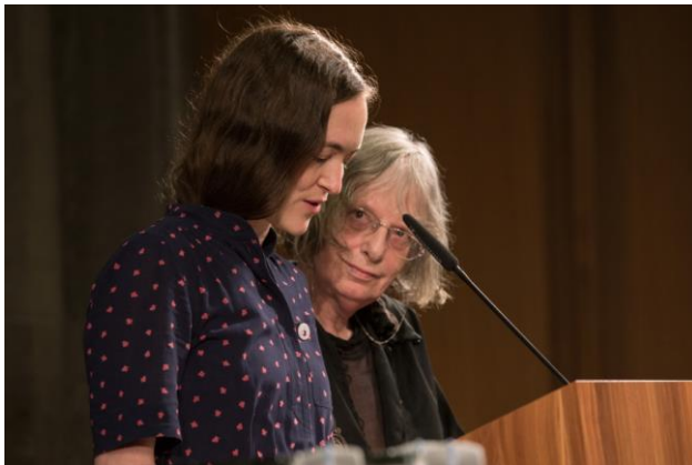
Німецька поетеса Ельке Ерб (праворуч) і чеська перекладачка Катка Рінґезова

Перекладацькі майстерні та мережеві зустрічі склалися з двох частин: навчально-методичної та публічної. Навчально-методична частина охоплювала, зокрема, спільну роботу учасників над перекладами у групах разом зі своїм ментором. Публічна частина включала один або декілька заходів, пов'язаних з художнім перекладом і популяризацією малих мов серед широкого загалу. Таким чином учасники проекту, з одного боку, мали можливість познайомитися з молодими й успішними авторами та митцями, а, отже, з літературними ландшафтами країн-учасниць проекту, з іншого боку, вони залучалися до організації та проведення багатьох публічних заходів, передусім, у рамках додаткового проекту Перекладацькі кубики – шість граней європейської літератури та перекладу . Завдяки цьому культурному проекту учасники з Німеччини, Слованії та України виступили, приміром, у Штуттґарті, де презентували уривки зі своїх перекладів; у Любляні учасники німецько-словенської групи були активно залучені до розробки програми Кубиків , організації заходів і їх проведення (одна учасниця, наприклад, модерувала вечір, а інші читали свої переклади).